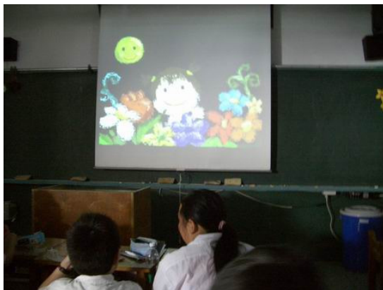
照片一： 童謠《月光華華》多媒體