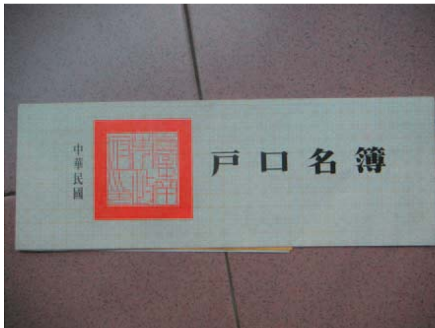
戶 口 名 簿 カニ 口 名 簿 出