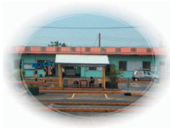
駕 ハ 駛 シ 訓 リ 練 カ 班 ノ