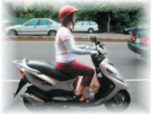
出 イ 門 カ 騎 リ 車 ノ 方 ニ 便 イ