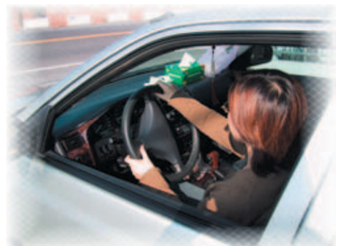
開 キ 車 ノ