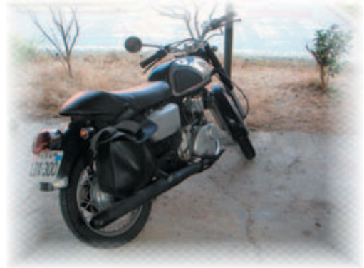
重 シ 型 ノ 機 キ 車 ノ