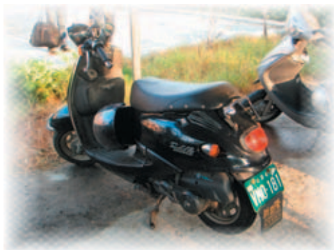
輕 シ 型 ノ 機 キ 車 ノ