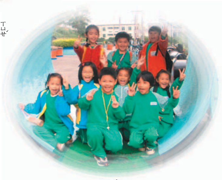
活 ㄟ 潑 ㄟ 的 ㄟ 孩 ㄟ 子 ㄟ