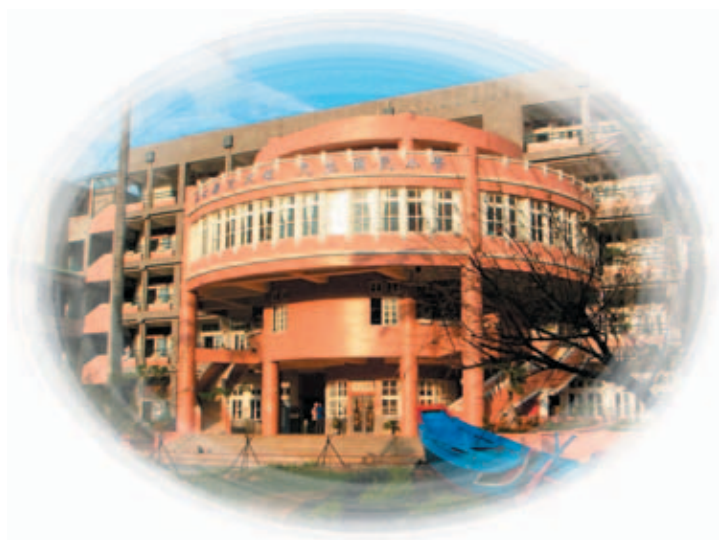
國 ㄟ 民 ㄟ 小 ㄟ 學 ㄟ

老 ㄟ 大 ㄟ 是 ㄟ 男 ㄟ 孩 ㄟ ， 喜 ㄟ 歡 ㄟ 看 ㄟ 書 ㄟ ； 老 ㄟ 二 ㄟ 外 ㄟ 向 ㄟ 活 ㄟ 潑 ㄟ ， 喜 ㄟ 歡 ㄟ 玩 ㄟ 球 ㄟ ； 老 ㄟ 三 ㄟ 是 ㄟ 女 ㄟ 孩 ㄟ ， 嬌 ㄟ 小 ㄟ 可 ㄟ 愛 ㄟ ， 喜 ㄟ 歡 ㄟ 畫 ㄟ 畫 ㄟ 。