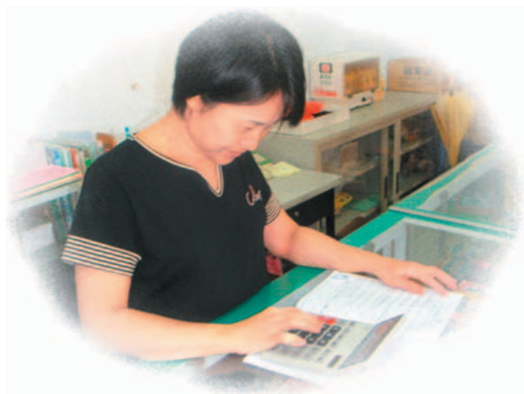
記 ㄐㄩˊ 帳 ㄓㄤˋ

我 ㄇ 想 ㄒㄩㄥˋ 當 ㄉㄨㄤˋ 個 ㄍㄜˊ 好 ㄏㄠˋ 幫 ㄅㄨㄛˋ 手 ㄕㄨㄟˋ ， 成 ㄇ 本 ㄇㄨㄣˊ 會 ㄏㄨㄟˊ 計 ㄐㄩㄥˋ 我 ㄇ 不 ㄉ 懂 ㄉㄨㄥˇ ， 識 ㄇ 字 ㄗㄩˊ 記 ㄐㄩˊ 帳 ㄓㄤˋ 慢 ㄇ 慢 ㄇ 學 ㄒㄩㄝˊ ， 出 ㄇ 貨 ㄏㄨㄚˊ 進 ㄐㄩㄥˊ 貨 ㄏㄨㄚˊ 跟 ㄍ 著 ㄓ 走 ㄗㄞˊ 。