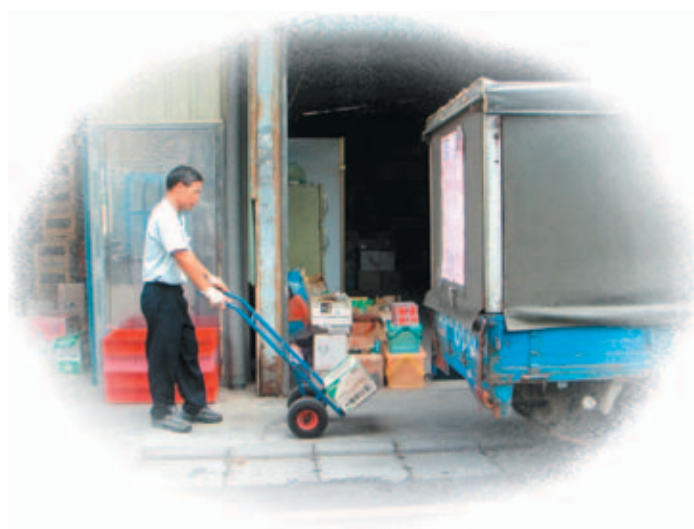
出 ㄇ 貨 ㄏㄨㄚˊ 進 ㄐㄩㄥˊ 貨 ㄏㄨㄚˊ