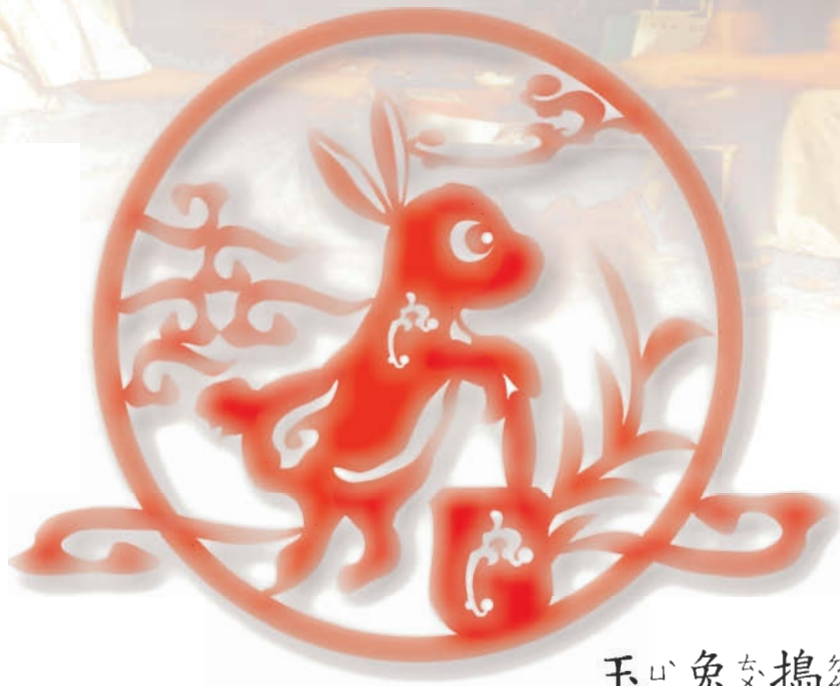
玉兔搗藥〈傳統剪紙〉